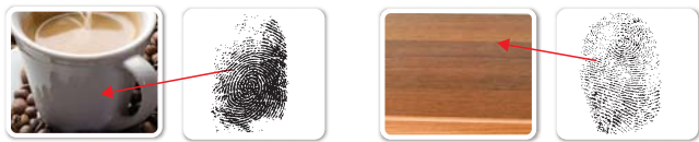
非渗透性客体上常见潜手印的胶片提取和扫描显现